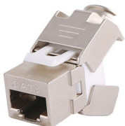
IDKJ6S EMBASE RJ45 CAT6 BLINDEE 360°