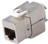
IDKJ6AS EMBASE RJ45 CAT6A BLINDEE 360°