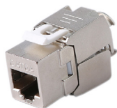
IDKJ6AS EMBASE RJ45 CAT6A BLINDEE 360°